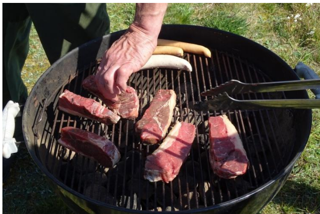
Møre og store bøffer som belønning