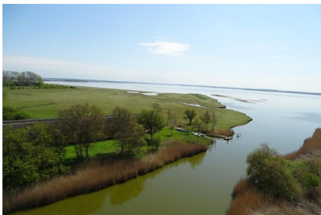
Udsigten fra toppen af møllen ud over Saltbæk Vig