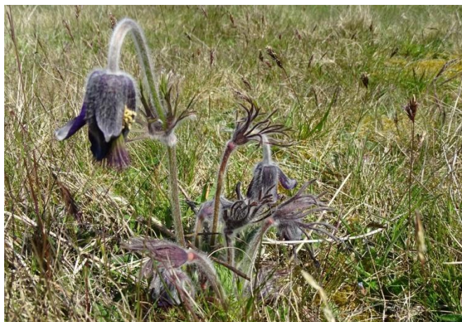
Nikkende kobjælde er Odsherred Kommunes ansvarsart