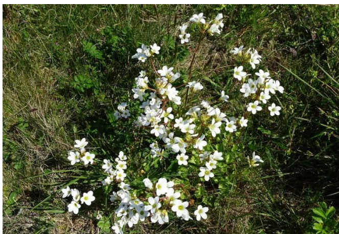
Kornet stenbræk ( Saxifraga granulata ), almindelig på grunden