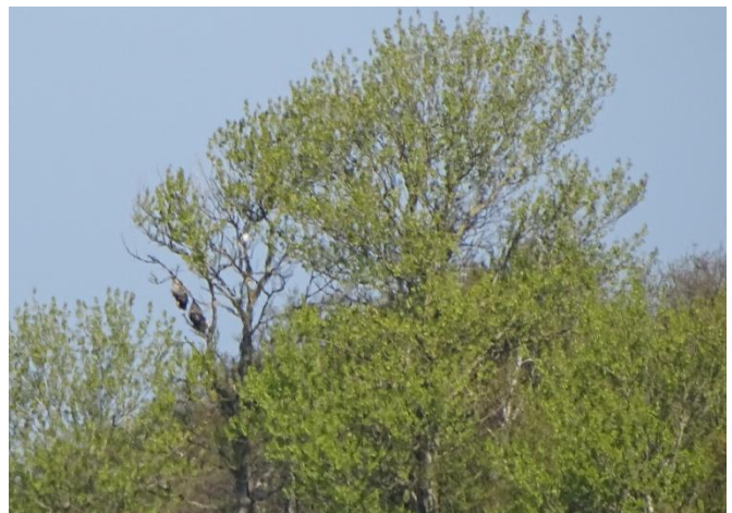
Havørnene er prikkerne i venstre side