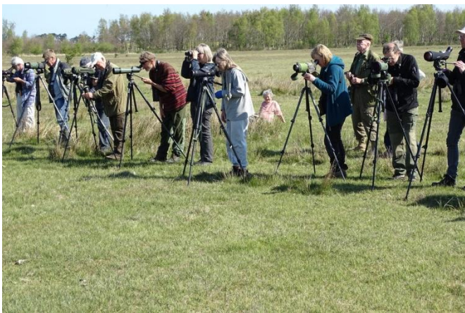
Punkttællerne øver sig i at obs'e