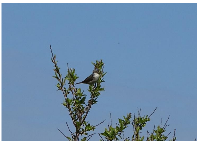
En gærdesanger underholdt os

Ikke mange fuglearter gæstede sommerhuset sammen med os, men et par landsvaler, et knarandepar og 2 tårnfalke kom dog forbi, ligesom gærdesangeren fløj rundt og underholdt os.