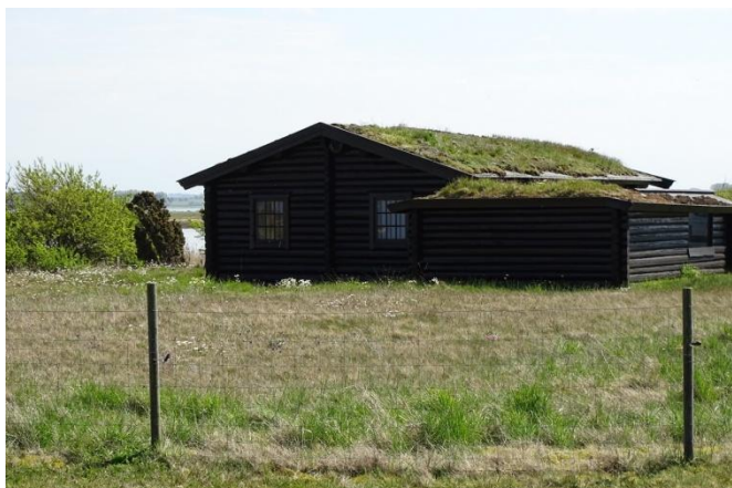
Fuglefondens sommerhus på den smukke grund på Store Vrøj

Vi fik hurtigt gang i grillen og bøfferne blev stegt, de var gode, dvs. store og møre og i det fantastiske vejr kunne man bare sætte sig overalt på den smukke grund og nyde naturen, herunder blomsterne., fuglene og altså den gode mad.