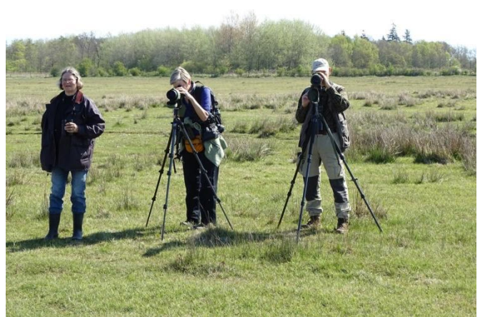
Jeg følte mig lige i skudlinjen

Listen over sete fuglearter med cirka antal indeholder bl.a.: Bramgås (>1000), Grågås (>1000), Gravand (20), Rødstjert, Løvsanger (>10), Gransanger, Gulspurv, Ravn, Munk, Spætmejse, Strandskade, Lærkefalk (1), Vibe, Skarv (500), Sølvmåge, Stormmåge, Hættemåge, Knopsvane, Krikand, Rørhøg (2), Klyde (70), Pibeand (2), Skeand, Havørn (3), Engpiber, Sanglærke, Fiskehejre, HF-terne, Ederfugl, Troland, Gråand, Sortklire, Musvit.