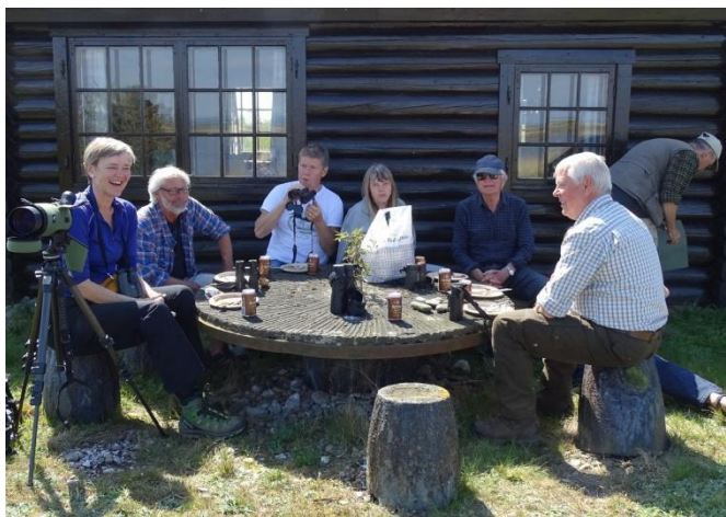
Hygge foran huset