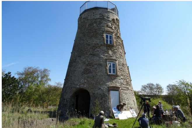
Pernille Buttenschøn fortæller foran møllen